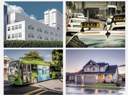
さまざまな施設で